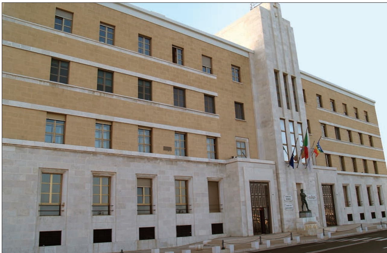
Sede Presidenza Giunta Regionale

Atti regionali Atti e comunicazioni degli Enti Locali